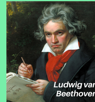
Ludwig van Beethoven